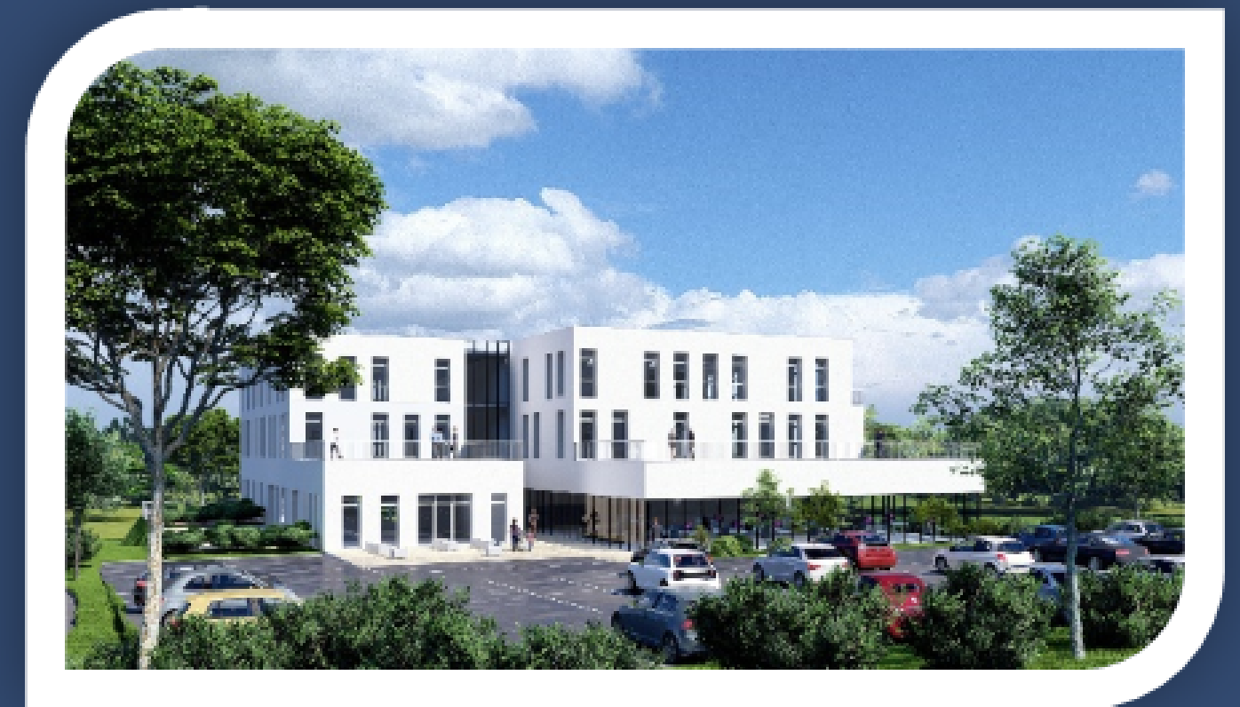
"Hall Parc" à Saint-Cyr-sur-Loire

Intruction du PC en cours pour la réalisation de 3600 m 2 de commerces et de bureaux