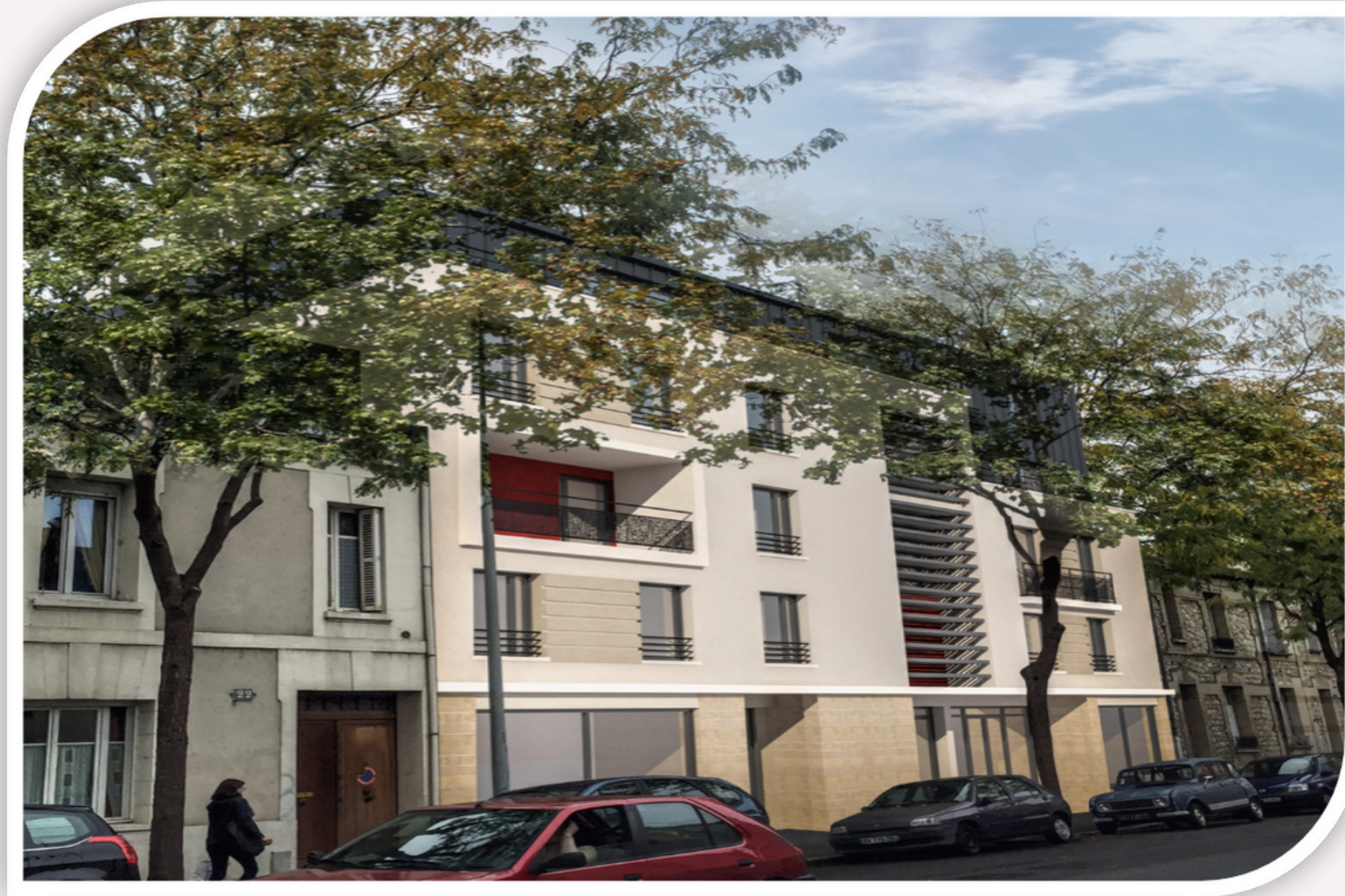
Résidence "Le Carré des Lys" à Tours

Livraison de 8 logements et un pôle santé en 2018