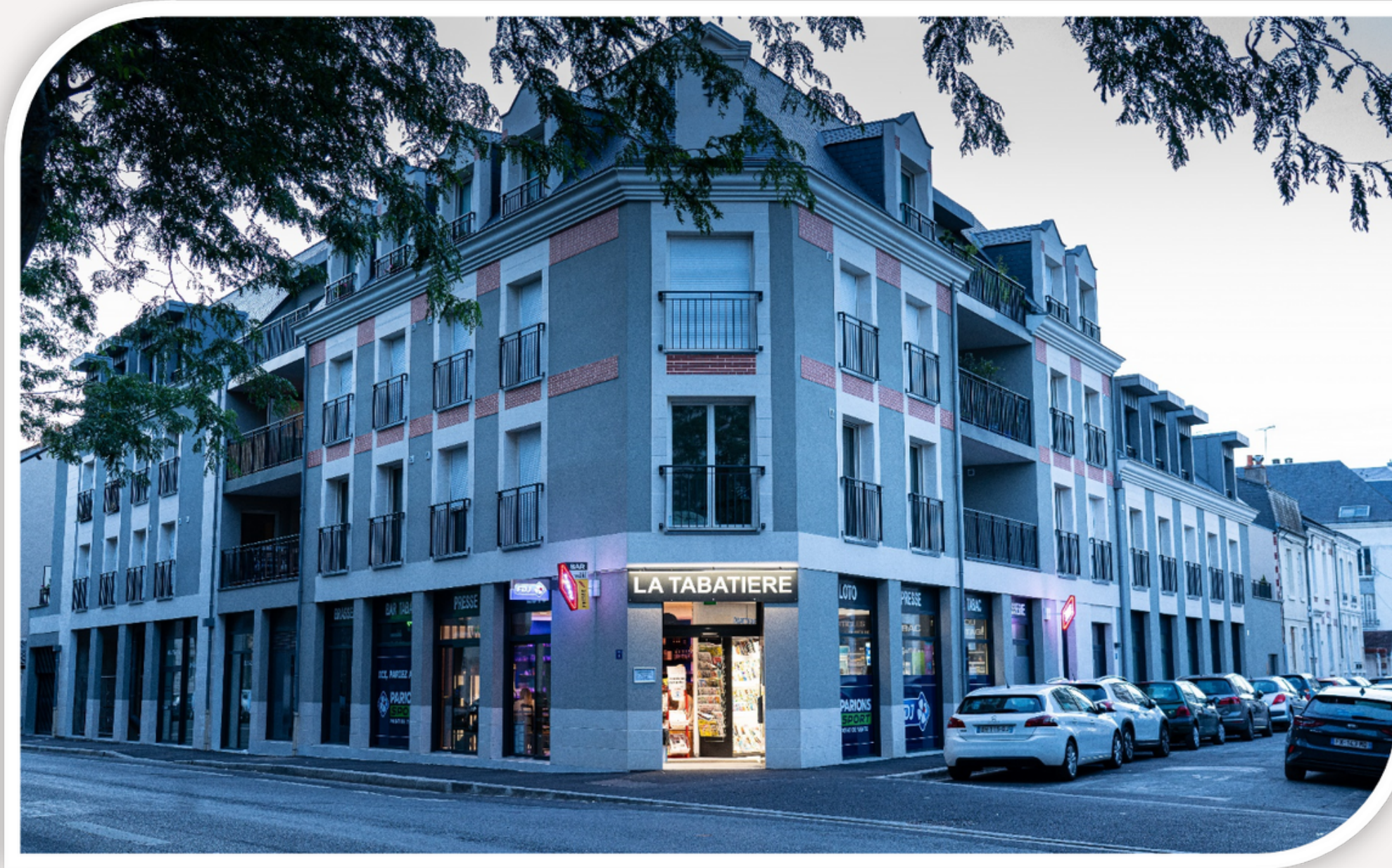
Résidence "Art Déco" à Tours

Livraison de 22 logements, de 2 commerces et un cabinet médical et paramédical en 2021